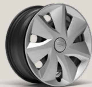
URBAN (16") LLANTAS DE ACERO R