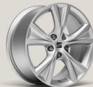
DYNAMIC 17" LLANTAS DE ALEACIÓN FR