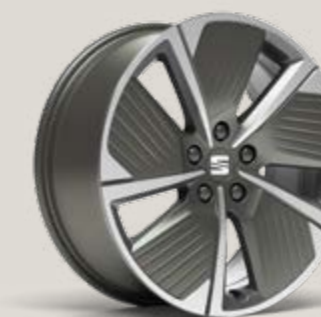
PERFORMANCE AERO 18" LLANTAS DE ALEACIÓN MECANIZADAS GRIS NUCLEAR Xc