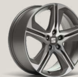
PERFORMANCE 18" LLANTAS DE ALEACIÓN MECANIZADAS GRIS COSMO FR