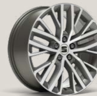
PERFORMANCE 18" LLANTAS DE ALEACIÓN MECANIZADAS GRIS NUCLEAR Xc