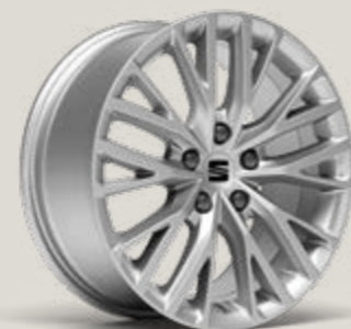
DYNAMIC 17" LLANTAS DE ALEACIÓN Xc