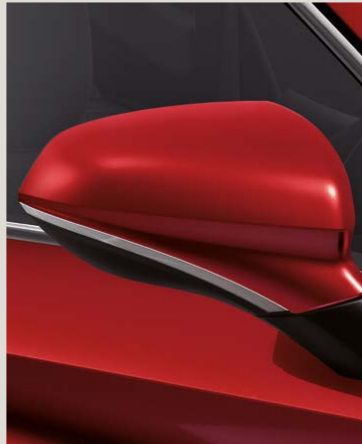
ROJO DESIRE 3

* Espejos exteriores en Gris Cosmo para el acabado FR