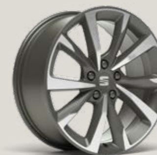
PERFORMANCE 18" LLANTAS DE ALEACIÓN MECANIZADAS GRIS COSMO FR