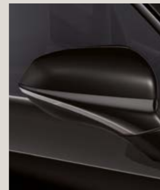
NEGRO MIDNIGHT 2