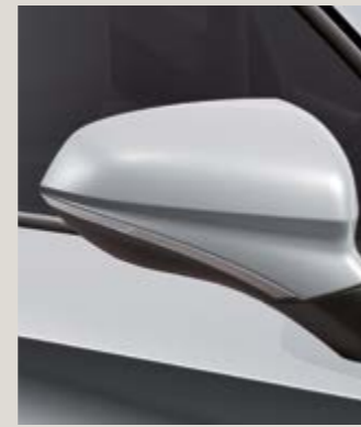
BLANCO NEVADA 2