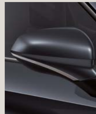
GRIS MAGNETIC 2