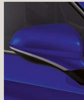
AZUL MISTERY 2